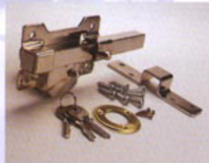
B1 - NIQUELADO