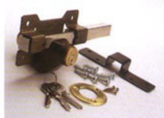
A1 - PINTADO