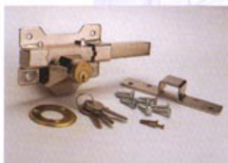
A1 - NIQUELADO