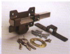
B1 - PINTADO