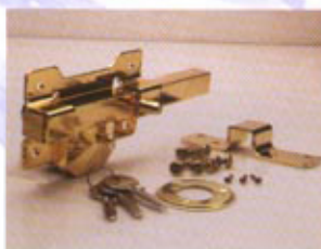
B1 - DORADO