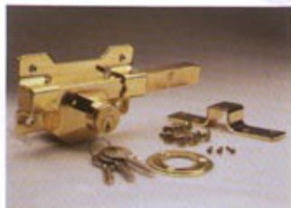
A1 - DORADO